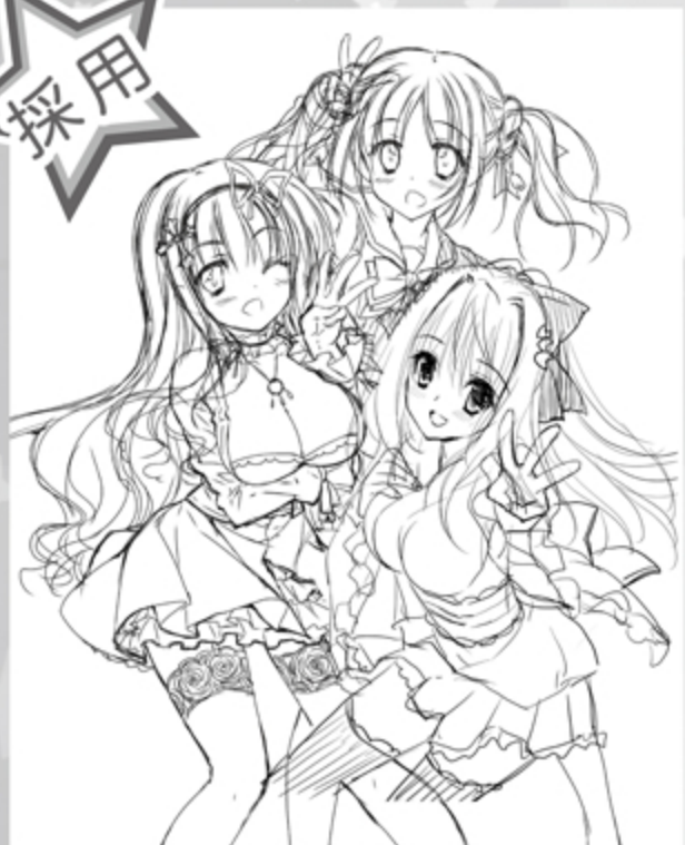
鈴井ナルミ・あらいぐま 作